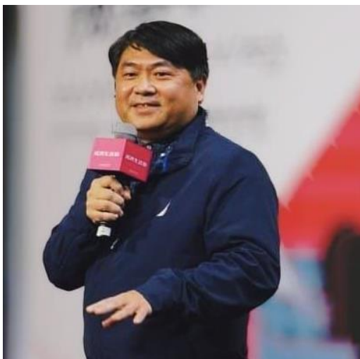
新北市產業觀光促進發展協會